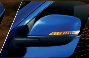
Espejos laterales eléctricos con luces direccionales