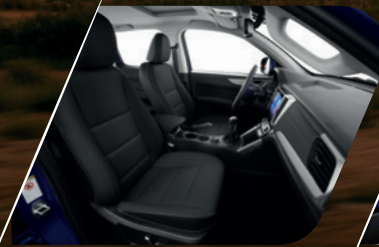
Asientos eco cuero